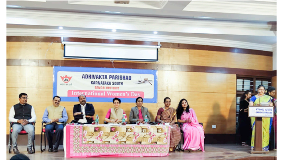
ಅಧಿವಾಸ ಪರಿಷತ್ ಬೆಂಗಳೂರು ಘಟಕದ ವತಿಯಿಂದ ಅಂತರಾಷ್ಟ್ರೀಯ ಮಹಿಳಾ ದಿನಾಚರಣೆಯನ್ನು ಬೆಂಗಳೂರಿನ ಗಾಂಧಿ ಭವನದಲ್ಲಿ ಆಚರಿಸಲಾಯಿತು. ಕಾರ್ಯಕ್ರಮದಲ್ಲಿ ಕರ್ನಾಟಕ ಉಚ್ಚ ನ್ಯಾಯಾಲಯದ ನ್ಯಾಯಮೂರ್ತಿಗಳಾದ ಕೆ.ಎಸ್. ಮುದುಗಲ್‌ರವರು ಮುಖ್ಯ ಅತಿಥಿಗಳಾಗಿ ಭಾಗವಹಿಸಿ ಪ್ರಮುಖ ಭಾಷಣ ಮಾಡಿದರು.

ಸಂಪುಟ : 44 ಸಂಚಿಕೆ : 24 ಚೈತ್ರ-ವೈಶಾಖ ಕಲಿಯುಗಾಬ್ಬ 5125 01-04-2023 ತ್ರೈವಾರ್ಷಿಕ : ರೂ. 150.00 ಬಿಡಿ ಪ್ರತಿ : ರೂ. 3.00 ಪುಟಗಳು : 4