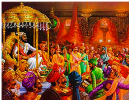
ಭತ್ತಪತಿ ಶಿವಾಜಿ ಮಹಾರಾಜರ ಪಟ್ಟಾಭಿಷೇಕದ 350 ವರ್ಷಗಳ ಸಂದರ್ಭದಲ್ಲಿ ಸರಕಾರ್ಯವಾಹ ದತ್ತಾತ್ರೇಯ ಹೊಸಬಾಳೆಯವರ ಹೇಳಿಕೆ.

ಭತ್ತಪತಿ ಶಿವಾಜಿ ಮಹಾರಾಜರು ಭಾರತದ ಸಮಾಜದಲ್ಲಿ ದ್ವ ನೂರಾರು ವರ್ಷಗಳ ದಾಸ್ಯದ ಮಾನಸಿಕತೆಯಿಂದ ಮುಕ್ತಗೊಳಿಸಿ ಸಮಾಜದಲ್ಲಿ ಆತ್ಮವಿಶ್ವಾಸ ಮತ್ತು ಆತ್ಮಗೌರವದ ಭಾವವನ್ನು ಜಾಗೃತಗೊಳಿಸಿದ ವ್ಯಕ್ತಿಗಳಲ್ಲಿ ಒಬ್ಬರು. ಜೈಷ್ಠ ಶುಕ್ಲ ತ್ರಯೋದಶಿಯಂದು ಅವರ ರಾಜ್ಯಾಭಿಷೇಕಗೊಂಡು, ಹಿಂದವಿ ಸ್ವರಾಜ್ಯವು ಸ್ಥಾಪನೆಗೊಂಡಿತು. ಈ ವರ್ಷ ಹಿಂದವಿ ಸ್ವರಾಜ್ಯದ ಸ್ಥಾಪನೆಯಾಗಿ 350 ವರ್ಷಗಳಾಗಲಿದೆ. ಮಹಾರಾಷ್ಟ್ರವನ್ನೂ, ಸೇರಿಸಿಕೊಂಡಂತೆ ದೇಶಾದ್ಯಂತ ಈ ನಿಮಿತ್ತ ಅನೇಕಾನೇಕ ಕಾರ್ಯಕ್ರಮಗಳು ಆಯೋಜನೆಗೊಳ್ಳಲಿವೆ. ರಾಷ್ಟ್ರೀಯ ಸ್ವಯಂಸೇವಕ ಸಂಘ ಈ ಪಾವನ ಸಂದರ್ಭದಲ್ಲಿ ಭತ್ತಪತಿ ಮಹಾರಾಜರ ಪುಣ್ಯಸ್ಮರಣೆ ಮಾಡುತ್ತಾ ಸ್ವಯಂಸೇವಕರು ಮತ್ತು ಸಮಾಜದ ವಿವಿಧ ಘಟಕಗಳಿಗೆ ಆಯೋಜಿತ ಕಾರ್ಯಕ್ರಮದಲ್ಲಿ ಭಾಗಿಯಾಗಿ ಹಿಂದವಿ ಸ್ವರಾಜ್ಯದ ಸ್ಥಾಪನೆಯಂತಹ ಯುಗಪ್ರವರ್ತಕ ಘಟನೆಯನ್ನು ಪುನಃಸ್ಮರಣೆ ಮಾಡಲು ಕರೆ ನೀಡುತ್ತದೆ.