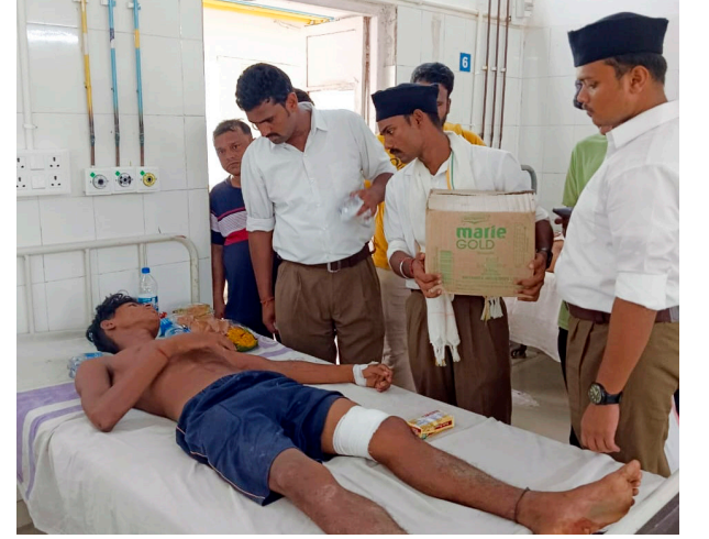
ಒರಿಸ್ಸಾದ ಬಾಲಸೋರ್ ನಲ್ಲಿ ಸಂಭವಿಸಿದ ಭೀಕರ ರೈಲು ದುರಂತದ ನಂತರ ಸೇವಾ ಕಾರ್ಯದಲ್ಲಿ ನಿರತರಾದ ರಾಷ್ಟ್ರೀಯ ಸ್ವಯಂಸೇವಕ ಸಂಘದ ಕಾರ್ಯಕರ್ತರು.

1974 ರ ಮೇ ತಿಂಗಳಲ್ಲಿ ಪುಣೆಯಲ್ಲಿ ಏರ್ಪಡಿಸಿದ್ದ ವಸಂತ ವ್ಯಾಖ್ಯಾನ ಮಾಲಾ ಎಂಬ ಉಪನ್ಯಾಸ ಮಾಲೆಯ ವೇದಿಕೆಯಿಂದ ನೀಡಿದ ಒಂದು ಪ್ರಮುಖ ಭಾಷಣದಲ್ಲಿ, ದೇವರಸ್‌ರು ಅಸ್ಪೃಶ್ಯತೆಯ ಆಚರಣೆಯನ್ನು ಖಂಡಿಸಿದರು ಮತ್ತು ಆರ್ಎಸ್ಎಸ್ ಸ್ವಯಂಸೇವಕರಿಗೆ ಅಸ್ಪೃಶ್ಯತೆಯ ಪಿಡುಗನ್ನು ತೆಗೆದುಹಾಕುವ ನಿಟ್ಟಿನಲ್ಲಿ ಕೆಲಸ ಮಾಡುವಂತೆ ಮನವಿ ಮಾಡಿದರು. ಇದೇ ಭಾಷಣದಲ್ಲಿ ಬಾಳಾಸಾಹೇಬರು “ಅಸ್ಪೃಶ್ಯತೆ ಪಾಪವಲ್ಲವಾದರೆ ಜಗತ್ತಿನಲ್ಲಿ ಯಾವುದೂ ಪಾಪವಲ್ಲ” ಎಂದು ಉದ್ಗರಿಸಿದ್ದರು. ಸರಸಂಘಚಾಲಕರ ಈ ಕರೆಯಿಂದ ಸ್ನೂರ್ತಿಗೊಂಡ ಸಂಘದ ಸ್ವಯಂಸೇವಕರು ಹೊಸ ಹುರುಪಿನೊಂದಿಗೆ ಜಾತಿ ಆಧಾರಿತ ತಾರತಮ್ಯದ ಭೂತದ ವಿರುದ್ಧ ಹೋರಾಡಲು ಕಾರಣವಾಯಿತು. ಸರಸಂಘಚಾಲಕರಾಗಿ 21 ವರ್ಷಗಳ ಕಾಲ ಜವಾಬ್ದಾರಿ ನಿರ್ವಹಿಸಿದ ಬಾಳಾಸಾಹೇಬರು ಜಾತಿ ಆಧಾರಿತ ತಾರತಮ್ಯ ಮತ್ತು ಅಸ್ಪೃಶ್ಯತೆ ವಿರುದ್ಧ ಪಟ್ಟುಬಿಡದೆ ಪ್ರಚಾರ ಮಾಡಿದರು. 1991 ರಲ್ಲಿ ಸ್ಥಾಪನೆಯಾದ ಸ್ವದೇಶಿ ಜಾಗರಣ ಮಂಚ್ ಬಾಳಾಸಾಹೇಬರ ಮೆದುಳಿನ ಕೂಸು. ಇದು ಸ್ವದೇಶಿಯತೆಯನ್ನು ರಕ್ಷಿಸುವಲ್ಲಿ ಮತ್ತು ಸ್ವದೇಶಿ ಜಾಗೃತಿಯನ್ನು ಮೂಡಿಸುವ ಕಾರ್ಯನಿರ್ವಹಿಸುತ್ತಿದೆ.