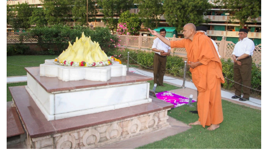
ನಾಗ್ಪುರದಲ್ಲಿ ನಡೆದ ರಾಷ್ಟ್ರೀಯ ಸ್ವಯಂಸೇವಕ ಸಂಘದ ತೃತೀಯ ವರ್ಷ ಸಂಘ ಶಿಕ್ಷಾ ವರ್ಗದ ಸಮಾರೋಹ ಸಮಾರಂಭದಲ್ಲಿ ಮುಖ್ಯಅತಿಥಿಯಾಗಿ ಭಾಗವಹಿಸಿದ್ದ ಕೊಲ್ಹಾಪುರದ ಕನೀರಿಯ ಶೀ ಸಿದ್ದಗಿರಿ ಸಂಸ್ಥಾನ ಮಠದ ಅಧ್ಯಕ್ಷ ಕಾಡಸಿದ್ದೇಶ್ವರ ಸ್ವಾಮೀಜಿ ಅವರಿಂದ ಶ್ರೀ ಗುರೂಜಿ ಗೋಲ್ಡಲ್ಡರ್ ಅವರ ಸಮಾಧಿ 'ಸ್ತುತಿ ಚಿಹ್ನೆ'ಗೆ ಪುಷ್ಪನಮನ