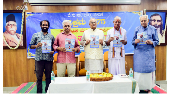
ವಿಕ್ರಮ ಕನ್ನಡ ವಾರಪತ್ರಿಕೆ ಪ್ರಾರಂಭಗೊಂಡು 75 ವರ್ಷಗಳ ಪೂರ್ಣಗೊಂಡ ಸುಸಂದರ್ಭದಲ್ಲಿ ಬೆಂಗಳೂರಿನ ಶಂಕರಪುರದ ರಂಗರಾವ್ ರಸ್ತೆಯಲ್ಲಿರುವ ಉತ್ತುಂಗ ಸಭಾಭವನದಲ್ಲಿ ಜುಲೈ 3 ರಂದು ಅಮೃತ ಸಂಭ್ರಮ ಕಾರ್ಯಕ್ರಮ ನಡೆಯಿತು.