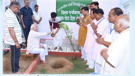
ರಾಷ್ಟ್ರೀಯ ಸ್ವಯಂಸೇವಕ ಸಂಘದ ಸರಸಂಘಚಾಲಕರಾದ ಡಾ.ಮೋಹನ್ ಭಾಗವತ್ ಅವರು ವಿಶ್ವ ಪರಿಸರ ದಿನದ ಪ್ರಯುಕ್ತ ರಾಜಸ್ಥಾನದ ಹಿಂದೋನ್ ಶಿಶು ವಾಟಿಕಾ ಪರಿಸರದಲ್ಲಿ ವಿದ್ಯಾಲಯದ ಆಡಳಿತ ಮಂಡಳಿಯವರ ಜೊತೆಗೂಡಿ ಗಿಡವನ್ನು ನೆಟ್ಟರು.

ಸಂಪುಟ : 46 ಸಂಚಿಕೆ : 06 ಶೋಭಕೃತ್ - ಆಪಾದ - ಅಧಿಕ ಶ್ರಾವಣ ಕಲಿಯುಗಾಬ್ಬ 5125 01-07-2023 ತ್ರೈವಾರ್ಷಿಕ : ರೂ. 150.00 ಬಿಡಿ ಪ್ರತಿ : ರೂ. 3.00 ಪುಟಗಳು : 4