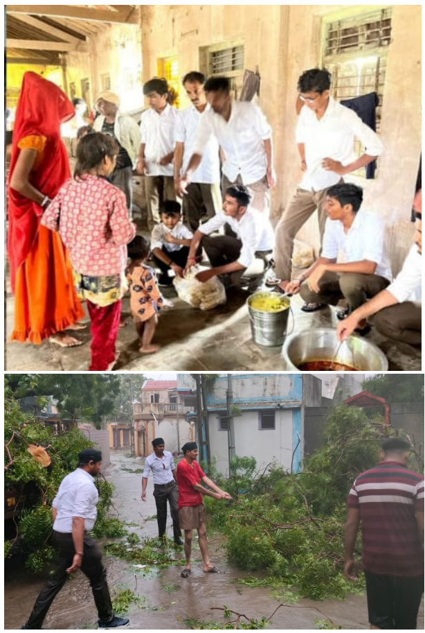
ಬಿಸರ್‌ಜಾಯ್ ಚಂಡಮಾರುತದಿಂದ ಹಾನಿಗೊಳಗಾದ ಪ್ರದೇಶಗಳಲ್ಲಿ ಸೇವಾ ನಿರತ ಆರ್.ಎಸ್.ಎಸ್. ಸ್ವಯಂಸೇವಕರು.