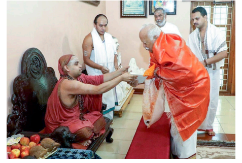
ರಾಷ್ಟ್ರೀಯ ಸ್ವಯಂಸೇವಕ ಸಂಘದ ಸರಸಂಘಚಾಲಕ ಡಾ. ಮೋಹನ್ ಭಾಗವತ್ ಅವರು ಶೃಂಗೇರಿಯ ಶ್ರೀ ತಾರದಾ ಪೀಠಕ್ಕೆ ಭೇಟಿ ನೀಡಿ ವಿಶೇಷ ಪೂಜೆ ಸಲ್ಲಿಸಿದರು. ಶೃಂಗೇರಿ ಮಠದ ಪೂಜ್ಯ ಶ್ರೀ ವಿಧುಶೇಖರ ಭಾರತೀ ಸ್ವಾಮಿಗಳ ಆಶೀರ್ವಾದ ಪಡೆದರು.