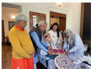
ಹಿರಿಯ ನಾಯಕ ಎಲ್.ಕೆ. ಅಡ್ವಾಣಿ