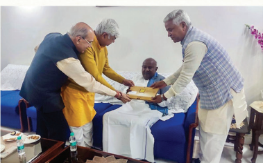
ಮಾಜಿ ಪ್ರಧಾನಿ ಹೆಚ್.ಡಿ. ದೇವೇಗೌಡ