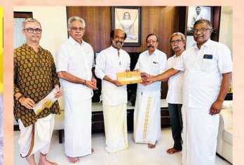
ಖ್ಯಾತ ಚಿತ್ರನಟ ರಜನಿಕಾಂತ್