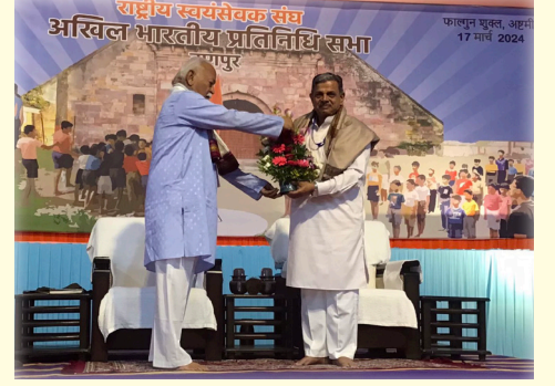
ನಾಗ್ಪುರ: ರಾಷ್ಟ್ರೀಯ ಸ್ವಯಂಸೇವಕ ಸಂಘದ ಸರಕಾರ್ಯವಾಹರಾಗಿ ದತ್ತಾತ್ರೇಯ ಹೊಸಬಾಳೆ ಮರು ಆಯ್ಕೆಯಾಗಿದ್ದಾರೆ.

ಸಂಪುಟ : 45 ಸಂಚಿಕೆ : 23 ಶೋಭಕೃತ್-ಕೋಡಿ ಫಾಲ್ಗುಣ-ಚೈತ್ರ ಕಲಿಯುಗಾಬ್ಬ 5126 - 5127 01-04-2024 ತ್ರೈವಾರ್ಷಿಕ : ರೂ. 150.00 ಬಿಡಿ ಪ್ರತಿ : ರೂ. 3.00 ಪುಟಗಳು : 4