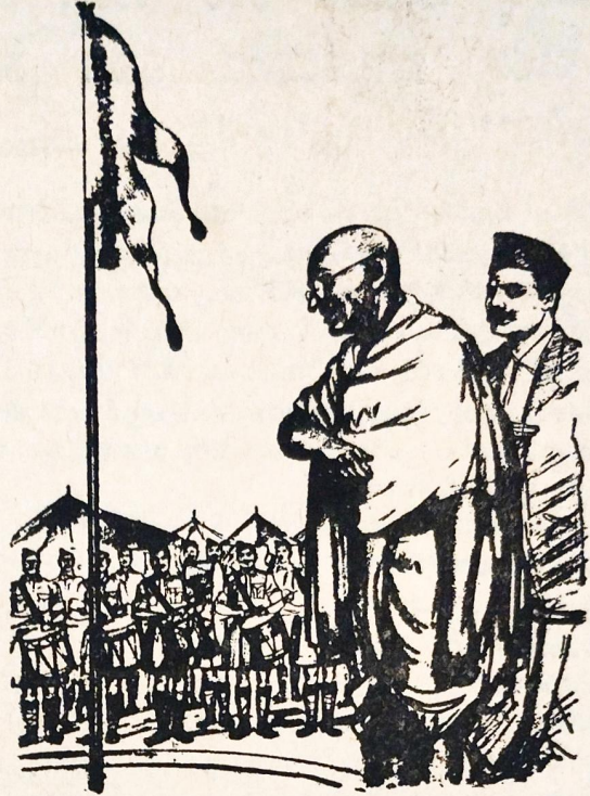
ಶಿಬಿರದಲ್ಲಿ ಗಾಂಧೀಜಿ ಸ್ವಯಂಸೇವಕರ ಜೊತೆಯಲ್ಲಿ ಭಗವಾ ಧ್ವಜಕ್ಕೆ ಸ್ತೂನಾಮ ಸಲ್ಲಿಸಿದರು.

ಶಿಬಿರದ ಆಹ್ವಾನ ಪತ್ರಿಕೆಗಳನ್ನು ಕಳಿಸುವಾಗ ಮಹಾತ್ಮಾಜಿಯವರಿಗೂ ಕಳಿಸಲಾಗಿತ್ತು. ಆದರೆ ಈ ಶಬ್ದಗಳಿಂದ ಅವರನ್ನು ವೈಯಕ್ತಿಕವಾಗಿ ಆಹ್ವಾನಿಸದೆ ನಾನು ಮಾಡಿದ ತಪ್ಪು ಅರಿವಾಯಿತು. ನಾನೆಂದೆ,